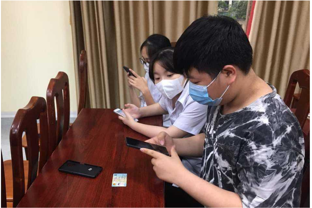
Đoàn viên thị xã chủ động nhập dữ liệu vào phần mềm Quản lý đoàn viên.

phường chúng tôi triển khai việc gắn mã QR cho các di tích lịch sử; lập và duy trì trang Blog “Hành trình di sản”. Thông thường tại các điểm di tích, để tìm hiểu cần có hướng dẫn viên nhưng với cách làm này, chỉ cần 1 chiếc điện thoại thông minh, người dân và du khách cũng có thể dễ dàng tìm kiếm được các thông tin về di tích, nắm được các thông tin một cách đầy đủ, tiện lợi và đảm bảo tính chính xác”.