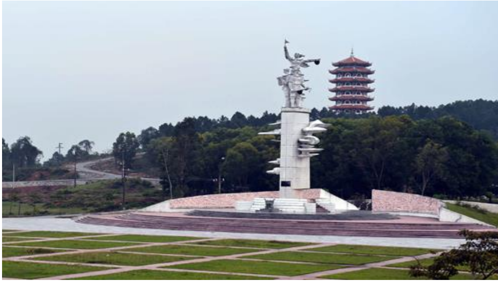
Khu tượng đài Chiến thắng Đồng Lộc.

làm việc. Đến 16 giờ 30 phút, trận bom thứ 15 trong ngày dội xuống Đồng Lộc. Một quả bom rơi trúng vào đội hình 10 cô gái. Một, hai phút, rồi năm phút trôi qua. Mặt đất mù mịt. Cả trận địa lặng đi rồi tiếng khóc vỡ òa. Các cô đã hy sinh.