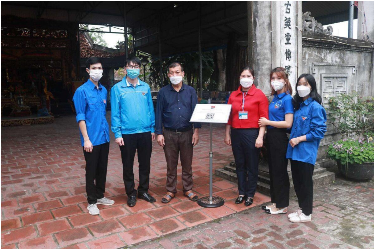
Đoàn phòhng Nam Hòa sáng tạo trong việc công nghệ số vào quảng bá du lịch trên địa bàn.

Tin tưởng rằng, lực lượng đoàn viên thanh niên với ưu thế là có sức khỏe, tri thức, sự sáng tạo, đặc biệt là những kiến thức, hiểu biết về công nghệ thông tin, những tiến bộ của khoa học – kỹ thuật, chắc chắn sẽ có nhiều lợi thế, tiềm năng để thực hiện thành công công tác chuyển đổi số. Qua đó, thể hiện vai trò xung kích, tiên phong của tuổi trẻ đảm nhiệm những phần việc khó, việc mới trong chủ động nghiên cứu, tiếp cận và ứng dụng công nghệ thông tin vào mọi lĩnh vực của đời sống xã hội một cách thiết thực, góp phần đảm bảo sự thành công của tiến trình chuyển đổi số trên địa bàn với chất lượng, hiệu quả cao.