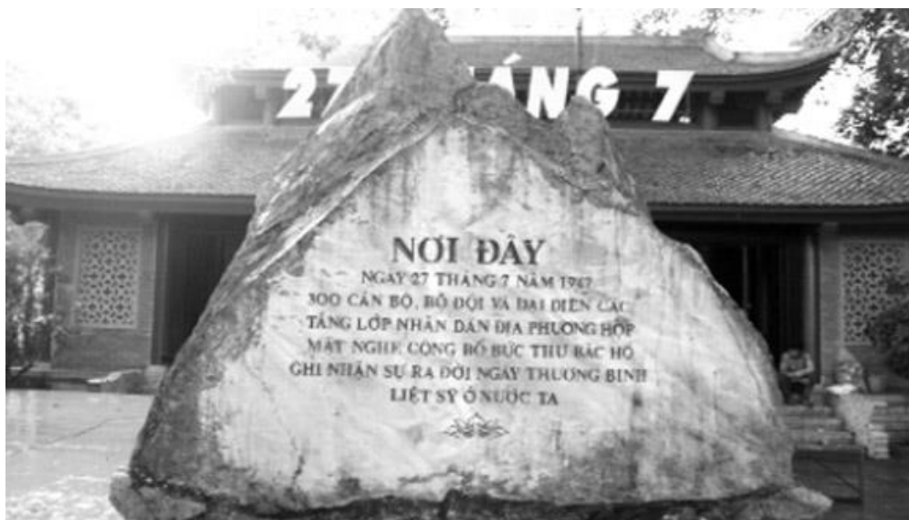
Hình minh họa: Đại từ, Thái Nguyên, nơi quyết định ngày 27/7 là ngày TBLS.

“... Tôi cũng rất mong muốn đồng bào sẵn sàng giúp đỡ họ về mặt vật chất và tinh thần...”.