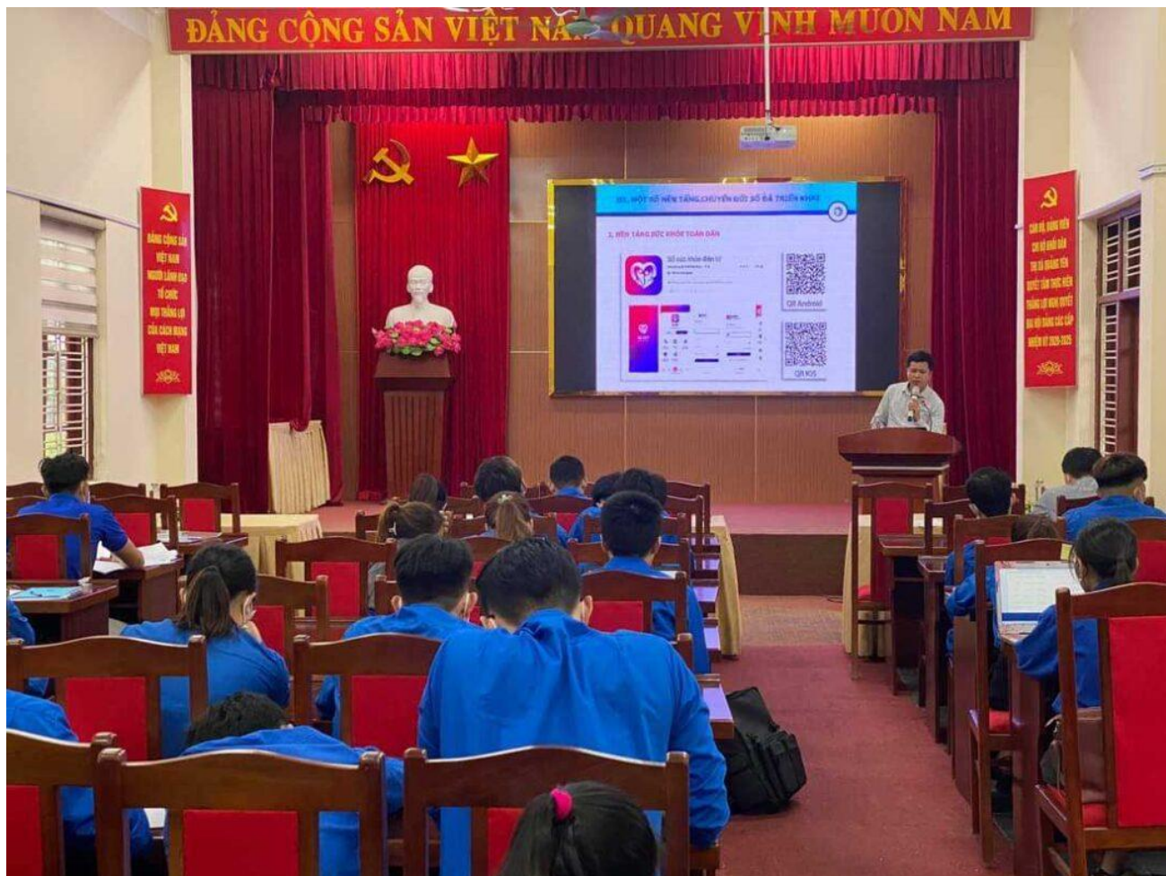
Thị Đoàn Quảng Yên tổ chức hội nghị tuyên truyền về chuyển đổi số cho đoàn viên thanh niên.

Với sức trẻ, sự nhanh nhạy, sáng tạo và kiến thức công nghệ thông tin, tuổi trẻ TX Quảng Yên đã và đang xung kích đi đầu, nỗ lực thể hiện vai trò trong công tác cải cách hành chính và chuyển đổi số.