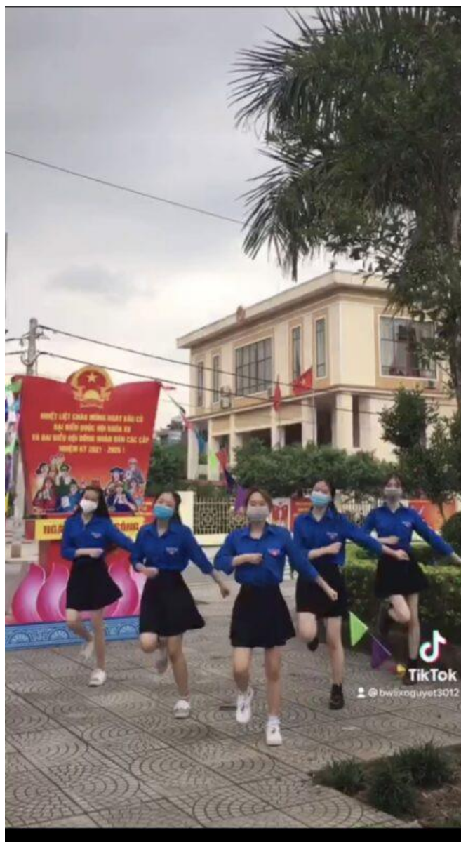
Tuổi trẻ Cẩm Phả, Bình Liêu hưởng ứng Vũ điệu Bầu cử (ảnh cắt từ clip).

đồng đảo sự tham gia, hưởng ứng của đoàn viên, tạo hiệu ứng truyền thông sâu rộng trong toàn đoàn. Ban Thường vụ Tỉnh đoàn đã nhận được hàng trăm video của các tập thể, cá nhân trong toàn tỉnh.