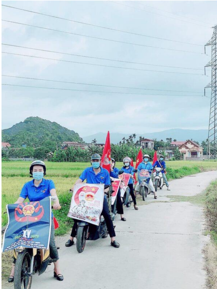
Thị đoàn Quảng Yên, Đông Triều triển khai mô hình đội thanh niên tuyên truyền lưu động.