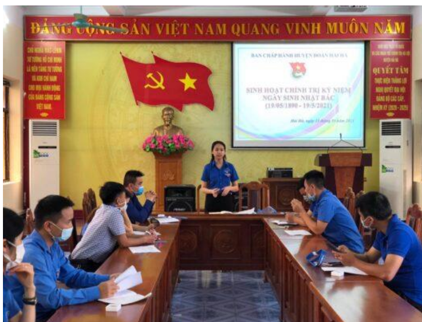
Tuổi trẻ Hải Hà, Đoàn Khối các cơ quan tỉnh tổ chức sinh hoạt chuyên đề kỷ niệm 131 năm Ngày sinh Chủ tịch Hồ Chí Minh vĩ đại (19/5/1890 – 19/5/2021)

Bên cạnh đó, các cấp bộ đoàn triển khai tổ chức sinh hoạt đồng loạt tổ chức sinh hoạt chuyên đề kỷ niệm 131 năm ngày sinh Chủ tịch Hồ Chí Minh, kỷ niệm 60 năm ngày Bác Hồ ra thăm Đảo Cô Tô và tuyên truyền về bầu cử Đại biểu Quốc hội và HĐND các cấp tập trung vào 2 ngày 17 – 18/5/2021 với các nội dung như chiếu phim tư liệu về cuộc đời, sự nghiệp Chủ tịch Hồ Chí Minh, tổ chức thảo luận, mạn đàm và lan tỏa danh sách các ứng cử viên tại các đơn vị bầu cử tới cử tri và nhân dân, vận động 100% cán bộ, đoàn viên, hội viên, cử tri trên địa bàn đi bầu cử, bầu đúng, bầu đủ và bầu trúng những người mà nhân dân tin tưởng với tỷ lệ phiếu cao nhất. Ngoài ra, đoàn thanh niên các địa phương đồng loạt tổ chức hoạt động tổng vệ sinh môi trường, tạo cảnh quan sạch, đẹp chào mừng cuộc bầu cử đại biểu Quốc hội khóa XV và đại biểu Hội đồng nhân dân các cấp, nhiệm kỳ 2021 – 2026.