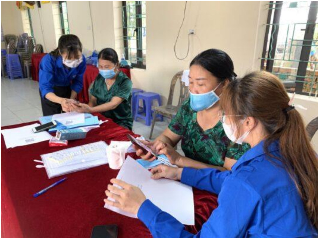
Tuổi trẻ Tiên Yên, Uông Bí tuyên truyền, hướng dẫn người dân cài đặt ứng dụng Bluezone, làm mặt nạ chống giọt bắn hỗ trợ công tác phòng, chống COVID-19

Nhằm tuyên truyền, vận động hướng dẫn đoàn viên thanh niên cài đặt Bluezone, khai báo y tế qua mã QR Code, Ban Thường vụ Tỉnh đoàn phối hợp Sở Thông tin và Truyền thông tỉnh tổ chức Hội nghị trực tuyến tới đoàn viên tại 13/13 địa phương và 177 xã, phường, thị trấn trong toàn tỉnh hướng dẫn, triển khai cài đặt ứng dụng Bluezone, khai báo y tế qua mã QR Code cho gần 2.000 cán bộ Đoàn chủ chốt các cấp, đoàn viên, thanh niên trong toàn tỉnh. Thông qua hội nghị đã giúp cho các cán bộ đoàn các cấp tiếp tục hiểu và triển khai ứng dụng hỗ trợ người dân khai báo y tế, cập nhật tình hình sức khỏe trực tuyến. Qua đó, sẽ giúp giảm nguy cơ lây nhiễm, tiết kiệm thời gian, chi phí khi khai báo y tế và phục vụ cho công tác quản lý dữ liệu, truy vết. Đây cũng là kênh chính thống để các cơ quan nhà nước có thẩm quyền gửi khuyến cáo đến người dân. Thực hiện sự chỉ đạo của Thường trực Tỉnh đoàn, các cấp bộ Đoàn, đoàn viên thanh niên trong tỉnh đã tiếp tục triển khai các hoạt động tham gia phòng chống dịch bệnh Covid-19, trong đó cao điểm tập trung tổ chức chiến dịch hướng dẫn, triển khai cài đặt ứng dụng Bluezone, khai báo y tế qua mã QR code nhằm góp phần giữ vững địa bàn “An toàn – ổn định trong trạng thái bình thường mới” và đảm bảo an toàn cho cuộc bầu cử đại biểu Quốc hội khóa XV và đại biểu HĐND các cấp nhiệm kỳ 2021 – 2026.