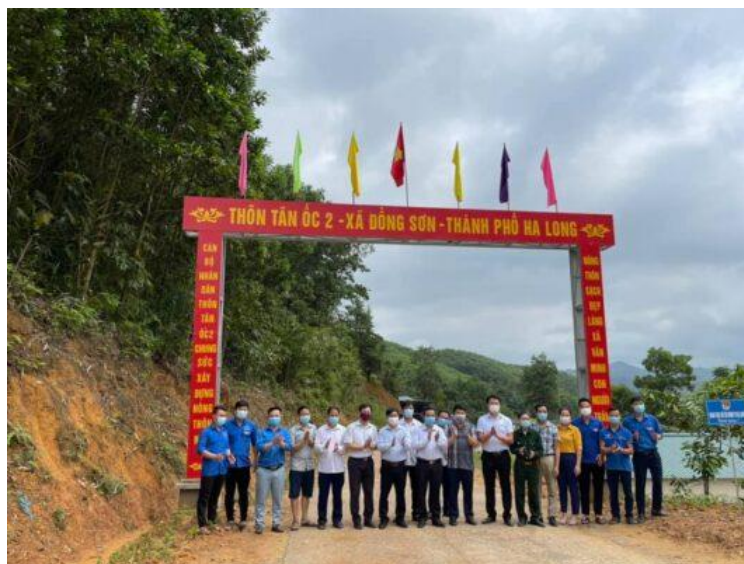
Thành đoàn Hạ Long khánh thành công trình chào mừng Cuộc bầu cử đại biểu Quốc hội khóa XV và đại biểu HĐND các cấp, nhiệm kỳ 2021-2026

Bên cạnh đó, các cấp bộ đoàn triển khai tổ chức sinh hoạt đồng loạt tổ chức sinh hoạt chuyên đề kỷ niệm 131 năm ngày sinh Chủ tịch Hồ Chí Minh, kỷ niệm 60 năm ngày Bác Hồ ra thăm Đảo Cô Tô và tuyên truyền về bầu cử Đại biểu Quốc hội và HĐND các cấp tập trung vào 2 ngày 17 – 18/5/2021 với các nội dung như chiếu phim tư liệu về cuộc đời, sự nghiệp Chủ tịch Hồ Chí Minh, tổ chức thảo luận, mạn đàm và lan tỏa danh sách các ứng cử viên tại các đơn vị bầu cử tới cử tri và nhân dân, vận động 100% cán bộ, đoàn viên, hội viên, cử tri trên địa bàn đi bầu cử, bầu đúng, bầu đủ và bầu trúng những người mà nhân dân tin tưởng với tỷ lệ phiếu cao nhất. Ngoài ra, đoàn thanh niên các địa phương đồng loạt tổ chức hoạt động tổng vệ sinh môi trường, tạo cảnh quan sạch, đẹp chào mừng cuộc bầu cử đại biểu Quốc hội khóa XV và đại biểu Hội đồng nhân dân các cấp, nhiệm kỳ 2021 – 2026.