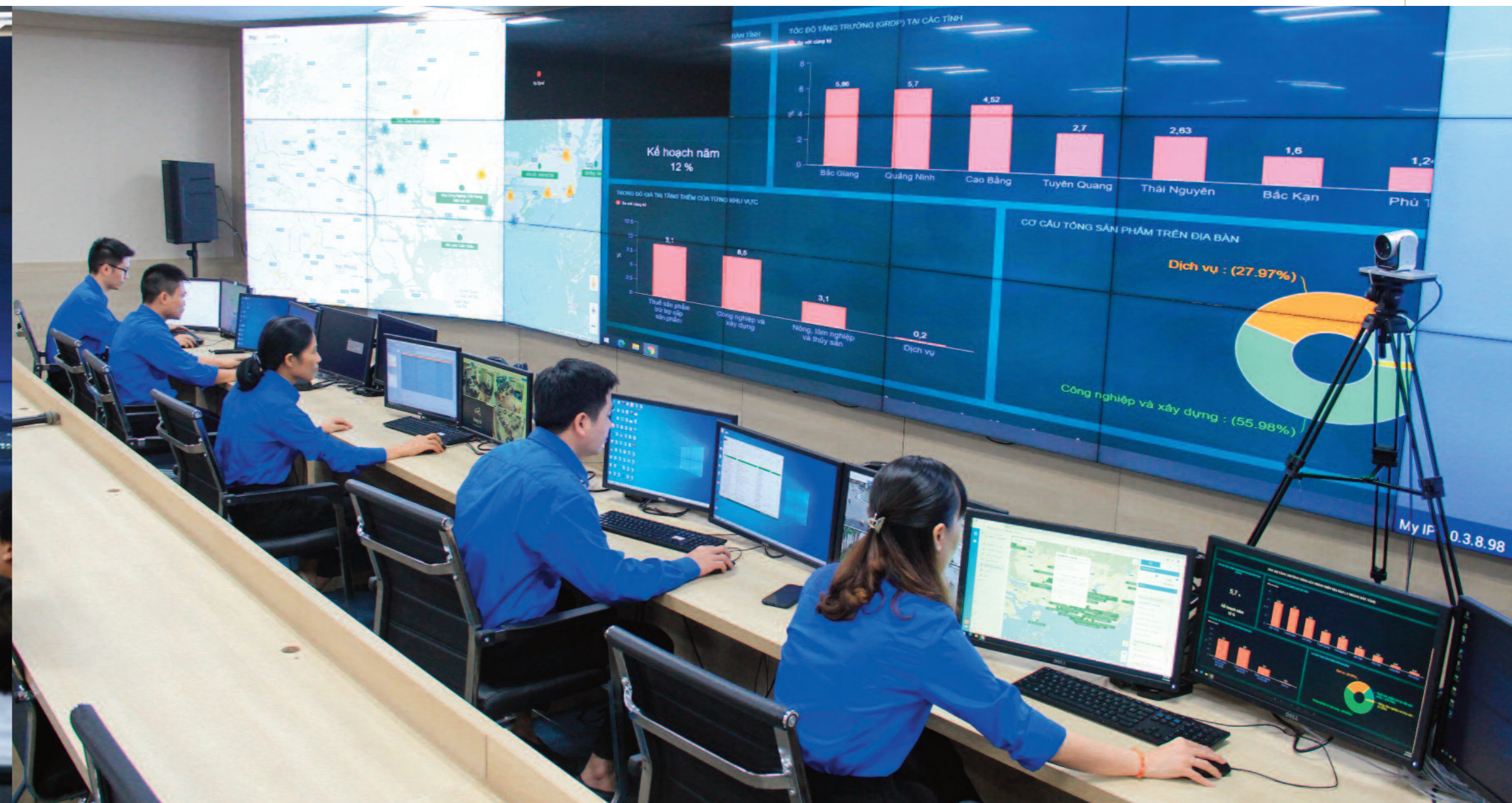
Đoàn viên thanh niên Văn phòng Ủy ban nhân dân tỉnh tham gia vận hành Trung tâm Điều hành thành phố thông minh