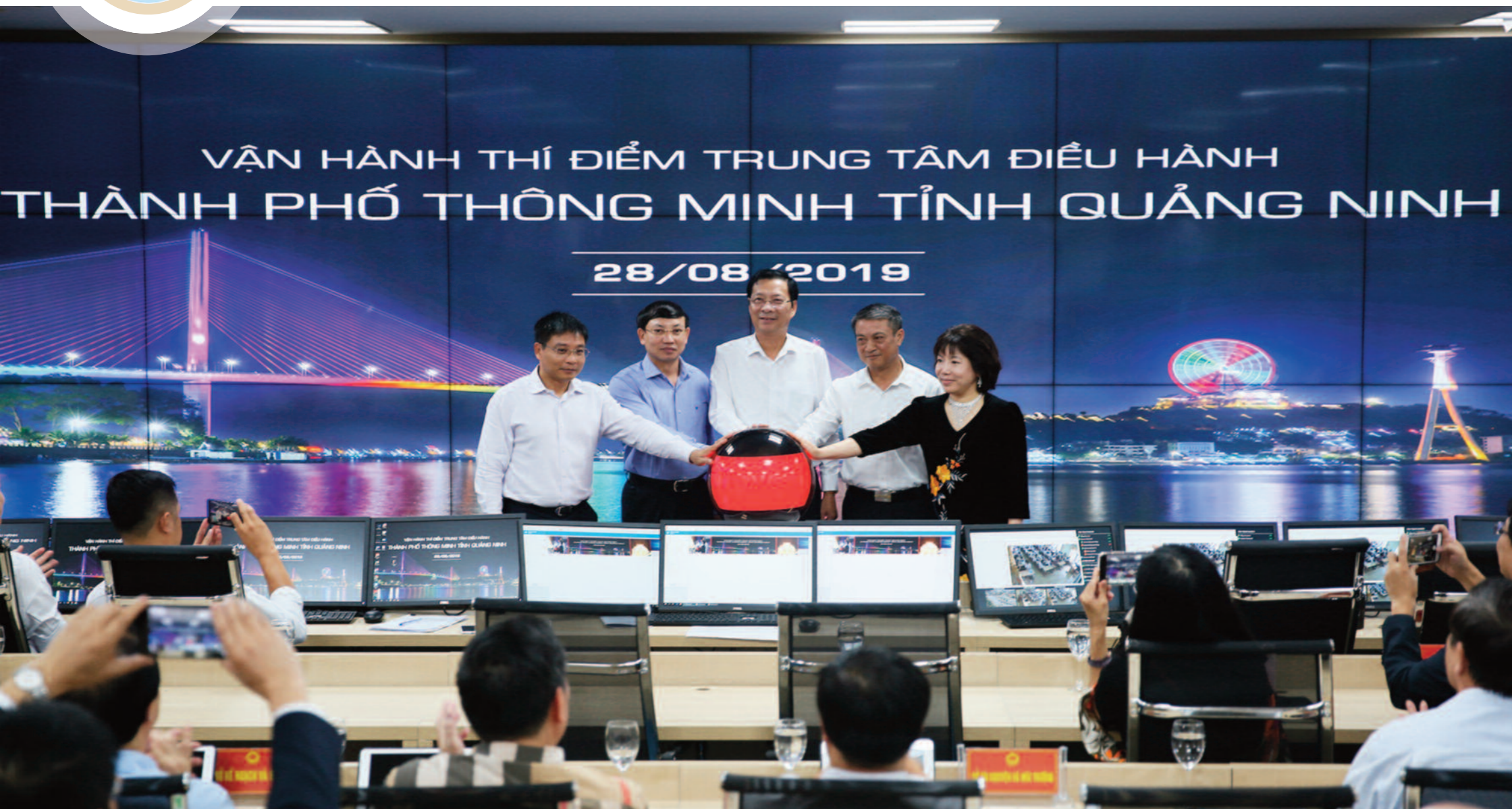
Lãnh đạo tỉnh Quảng Ninh khai trương vận hành Trung tâm điều hành thành phố thông minh tỉnh Quảng Ninh