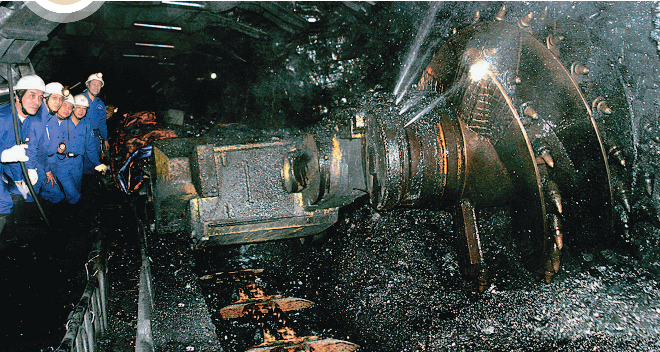
Áp dụng công nghệ khai thác than bằng dàn tự hành Vinaalta