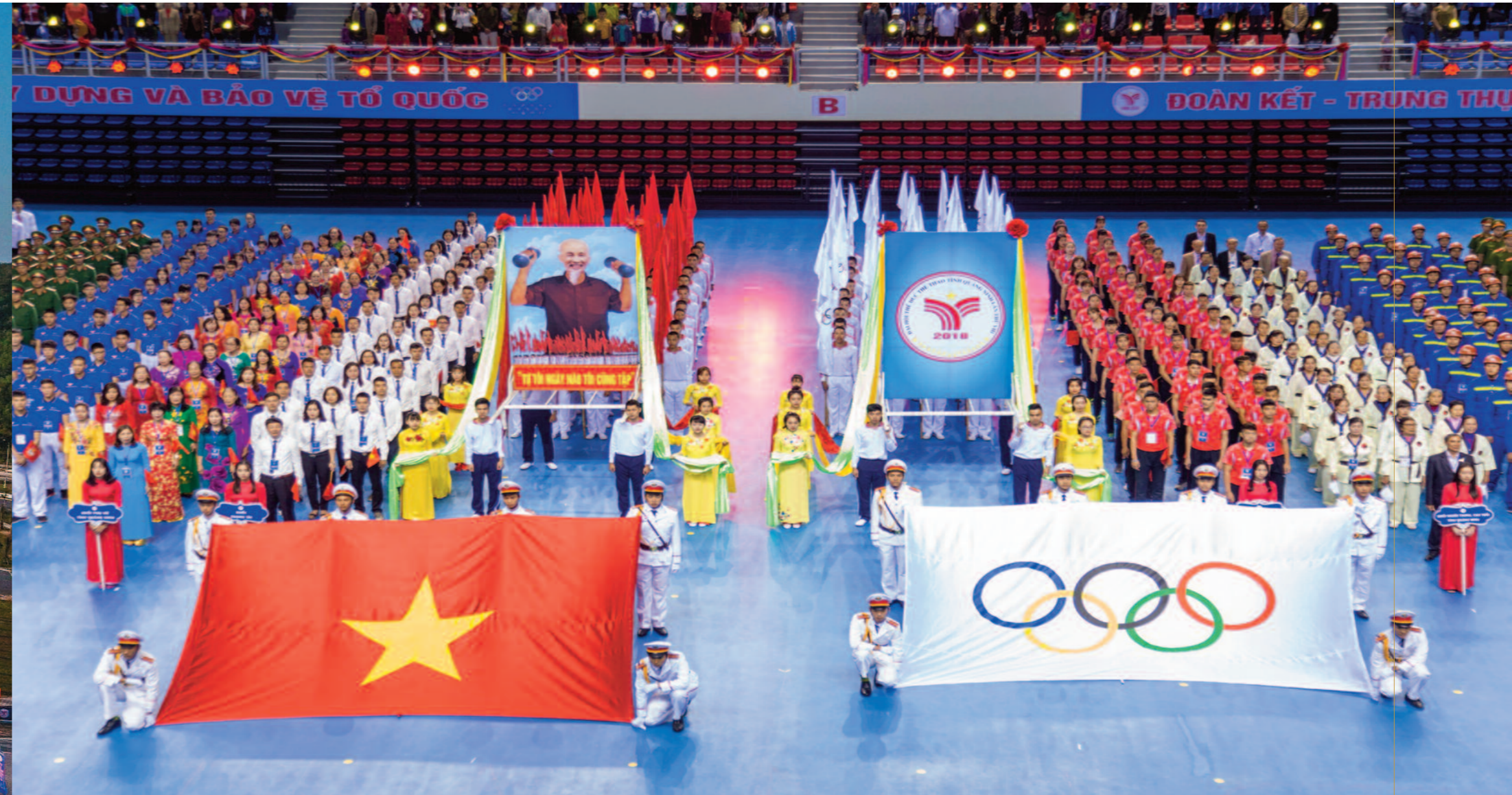
📍 Lễ Khai mạc Đại hội thể dục thể thao tỉnh Quảng Ninh lần thứ VIII (năm 2018) tại Nhà thi đấu Đông Bắc