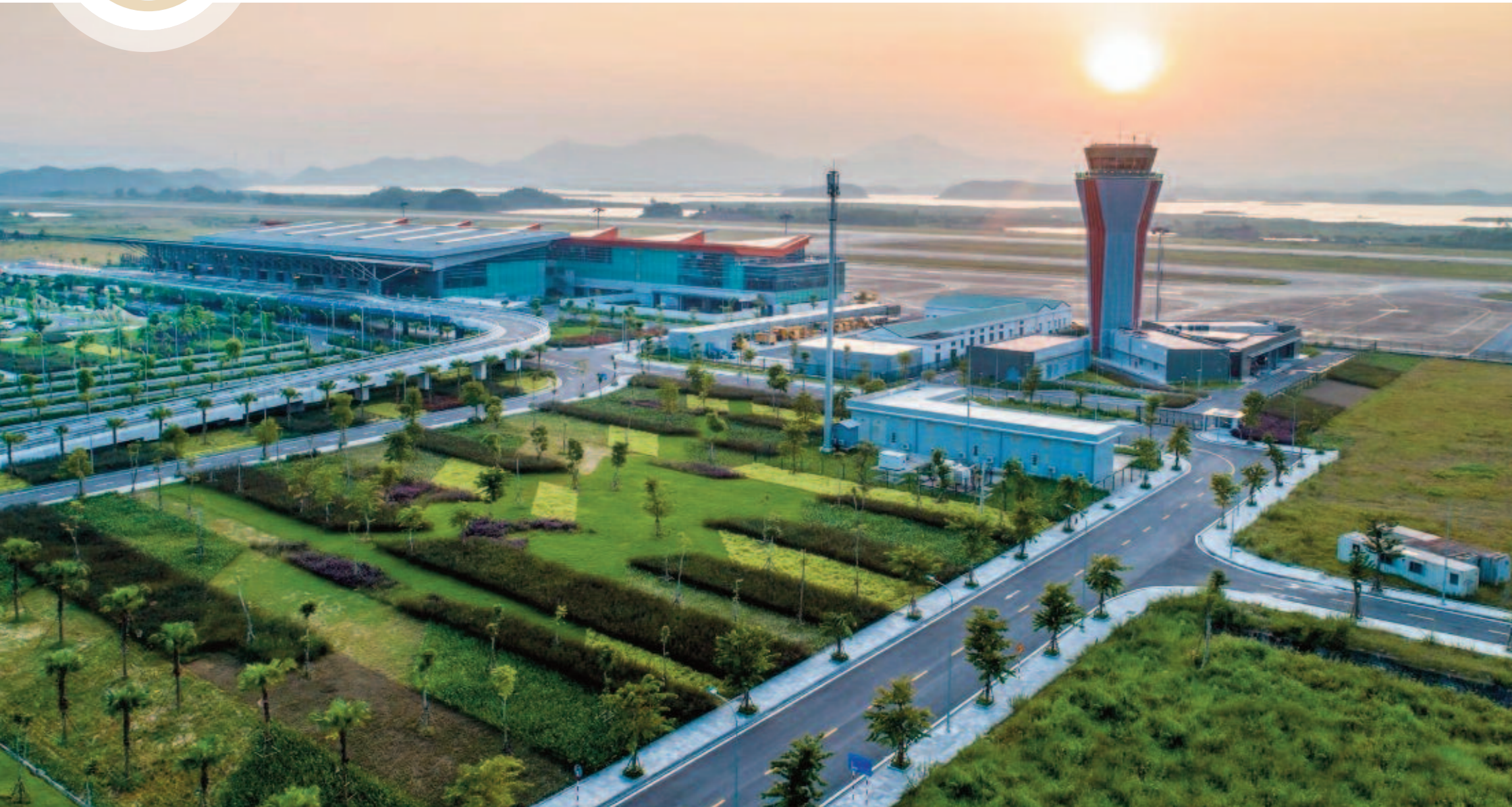
Cảng hàng không quốc tế Vân Đồn