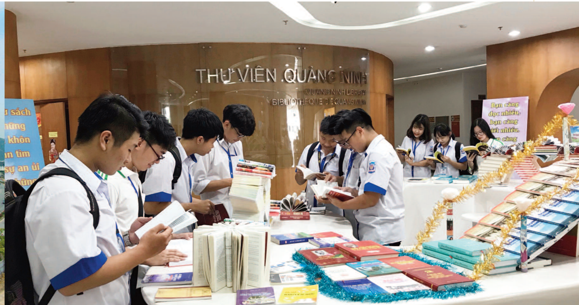
Đoàn viên thanh niên đọc sách tại Thư viện Quảng Ninh