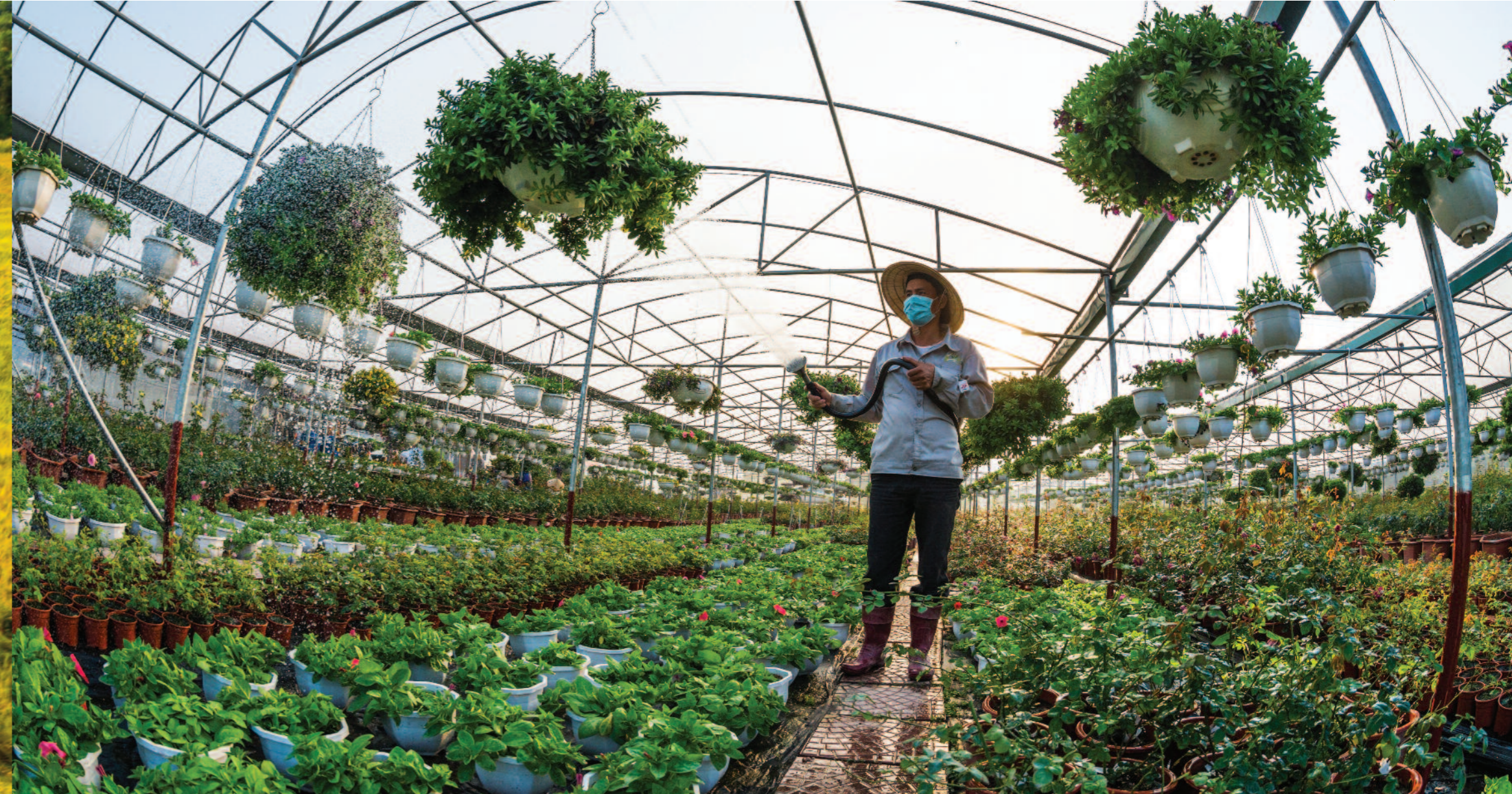
Mô hình trồng hoa công nghệ cao của thanh niên ở thành phố Hạ Long