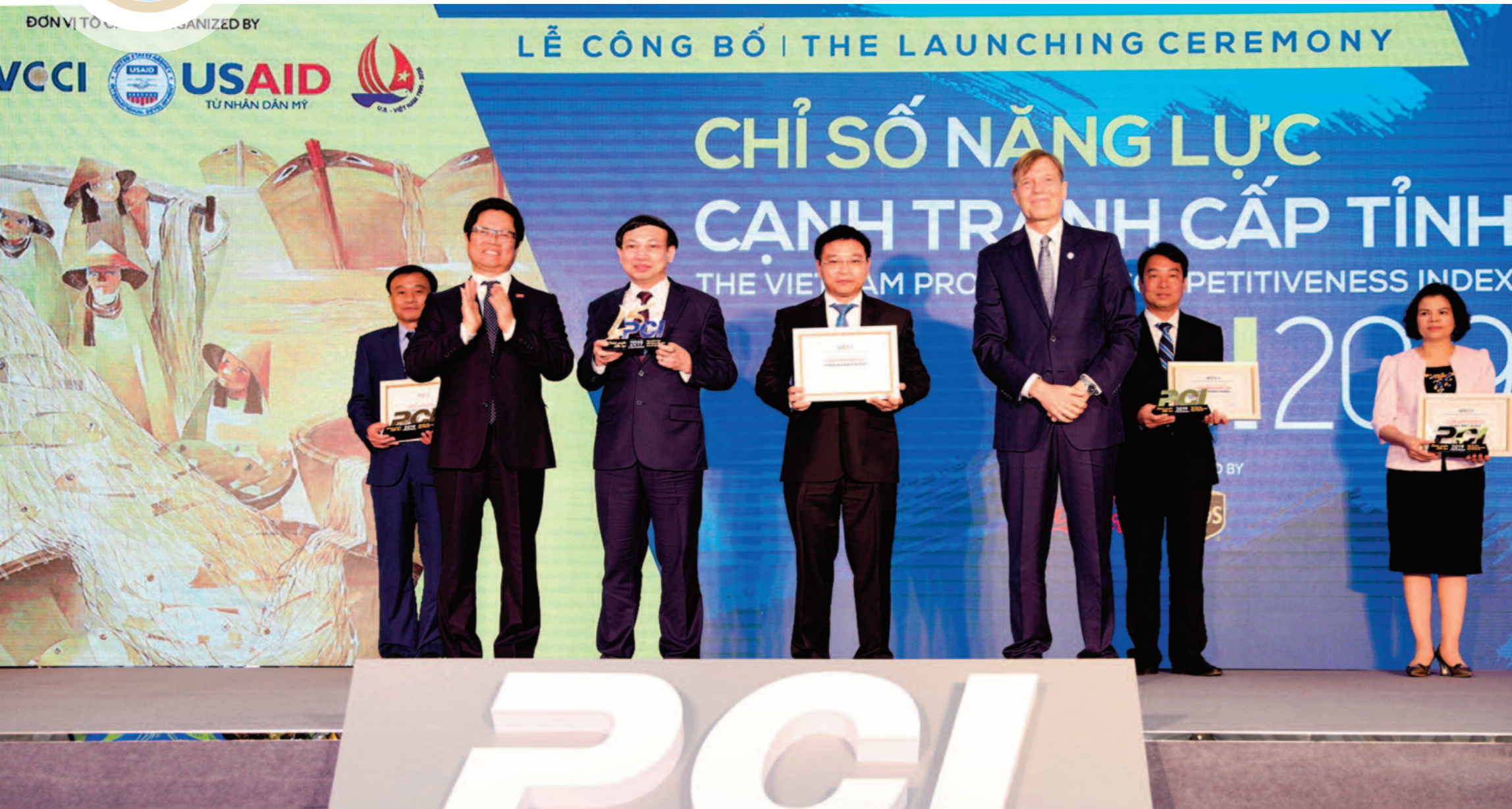
Lãnh đạo tỉnh Quảng Ninh khai trương vận hành Trung tâm điều hành thành phố thông minh tỉnh Quảng Ninh