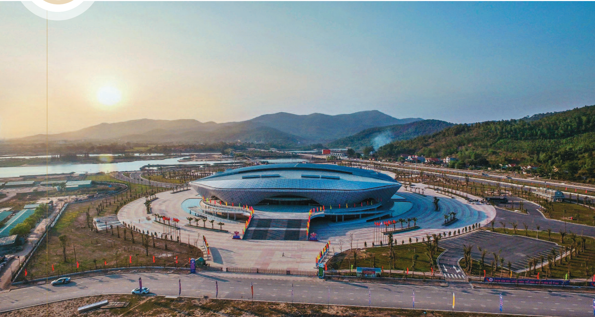
📍 Nhà thi đấu Đông Bắc (thành phố Hạ Long)