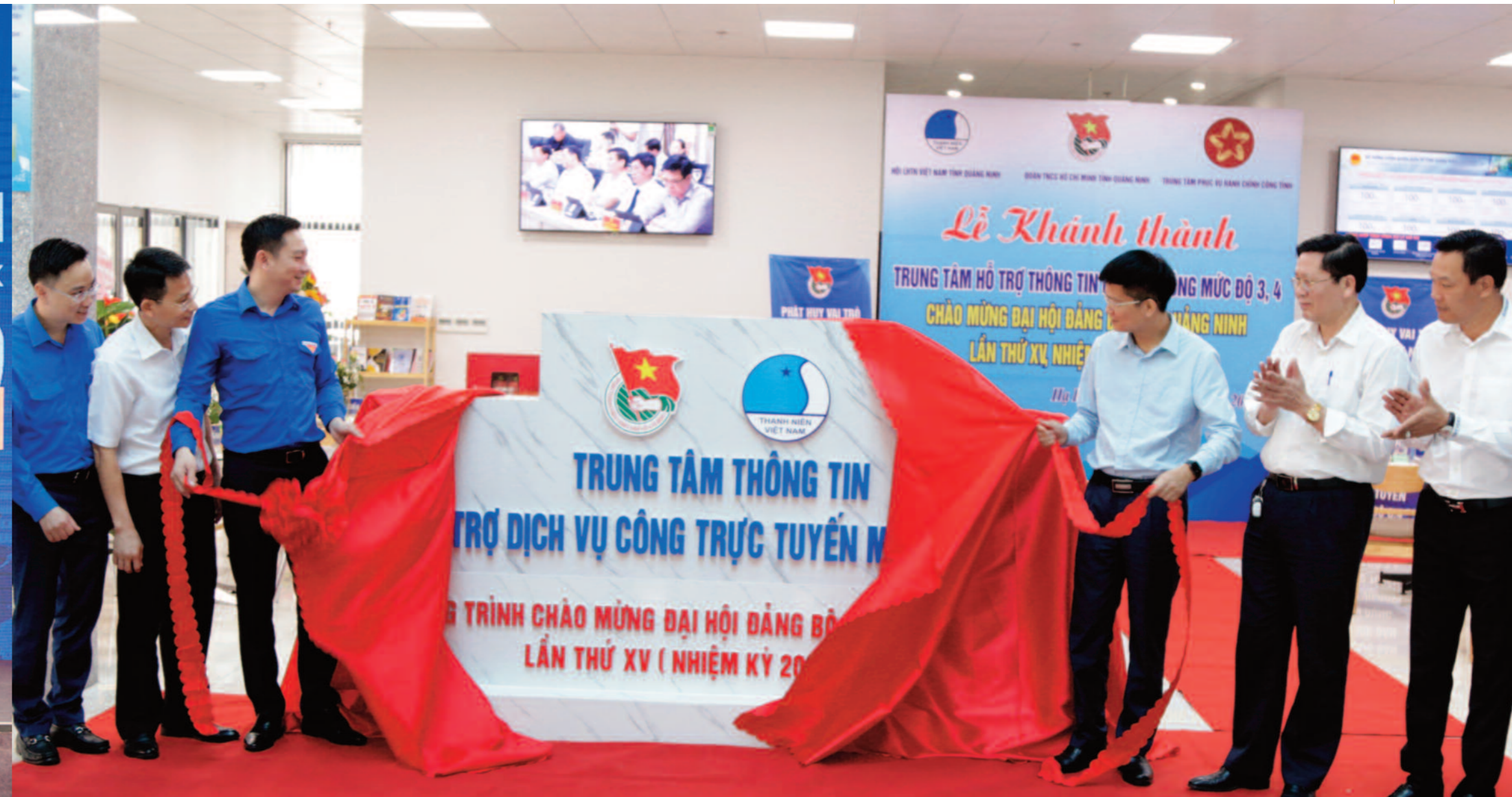
Trung tâm thông tin hỗ trợ Dịch vụ công trực tuyến mức độ 3,4 - Công trình của tuổi trẻ Quảng Ninh chào mừng Đại hội đại biểu Đảng bộ tỉnh Quảng Ninh lần thứ XV, nhiệm kỳ 2020 - 2025.