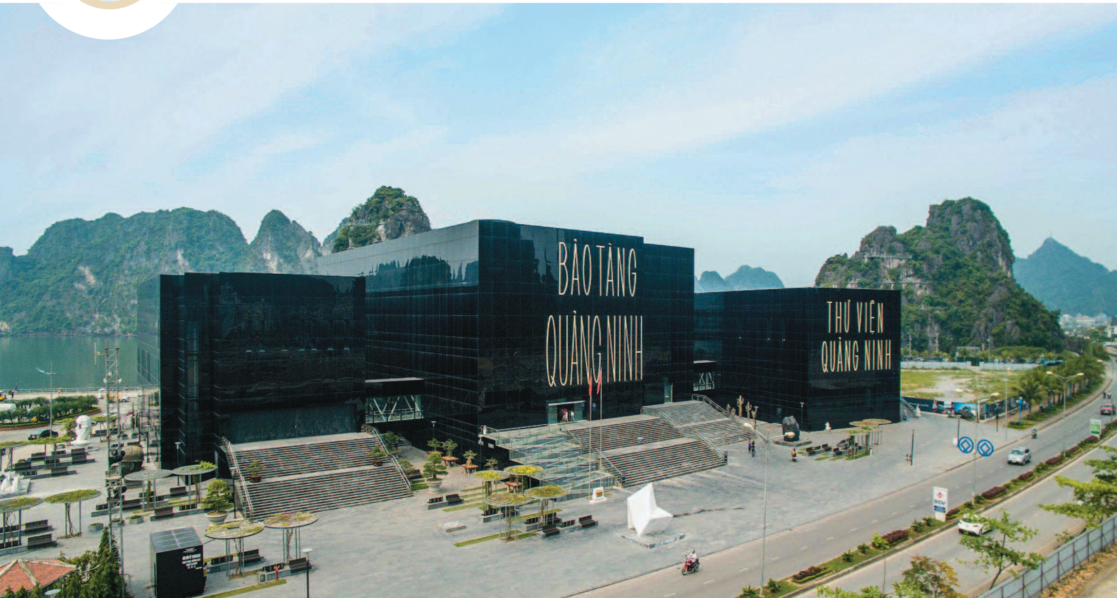
Bảo tàng - Thư viện tỉnh Quảng Ninh