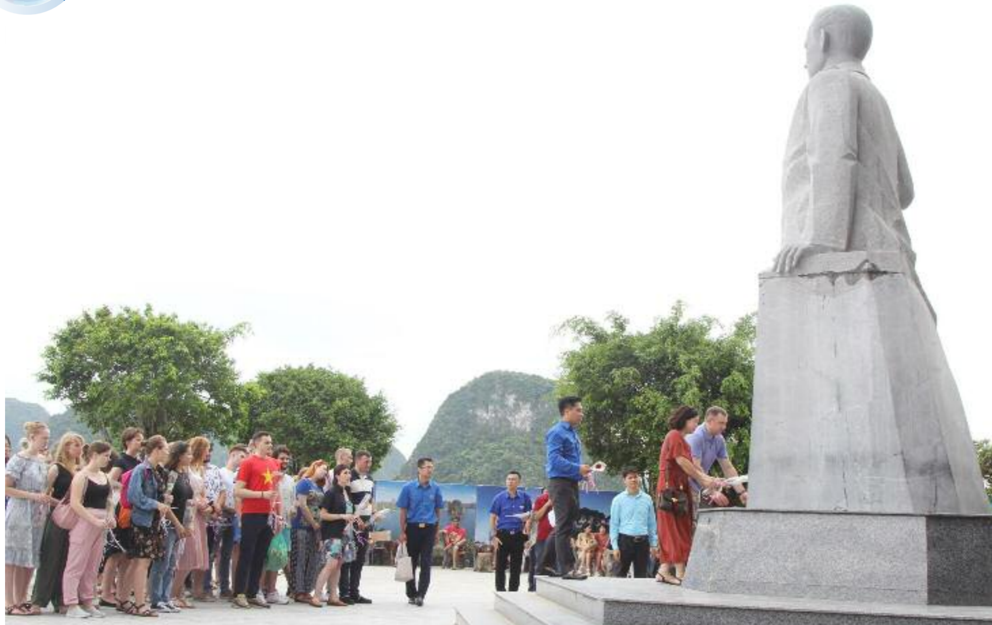
Đoàn đại biểu thanh niên Nga và thanh niên Quảng Ninh tổ chức dâng hoa tại tượng đài Titop, Hạ Long