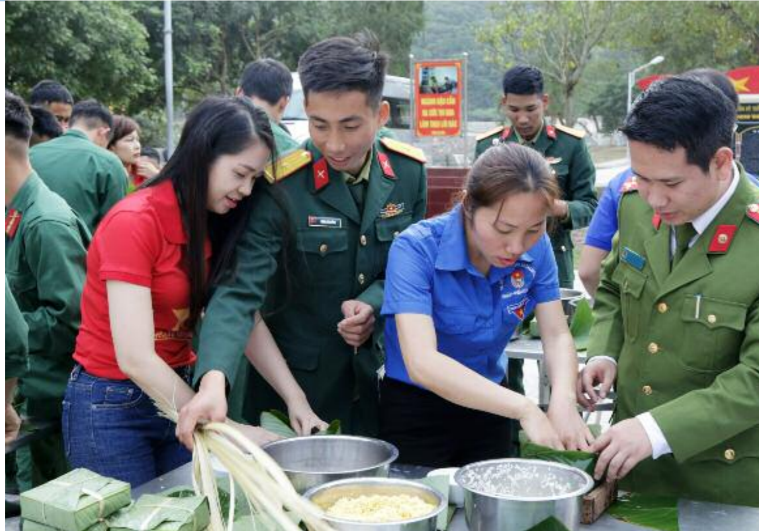
Tổ chức chương trình “Tuổi trẻ với mùa xuân biên giới”, gói bánh chưng tặng cán bộ, chiến sỹ đảo Trần dịp Tết Nguyên Đán Canh Tý 2020

Từ những hoạt động thực tiễn trong phong trào “Vĩ điểm tựa tiền tiêu”, trong thanh niên Quảng ninh đã hình thành và phát triển phong trào “Đoàn kết ba lực lượng”, ba lực lượng đó là thanh niên công an, thanh niên quân đội và thanh niên địa phương. Ngay từ đầu phong trào “Đoàn kết ba lực lượng” đã thu hút sự quan tâm của nhiều đối tượng thanh niên. Đoàn TNCS Hồ Chí Minh tỉnh Quảng Ninh đã kịp thời rút kinh nghiệm và đầu những năm 80 đã cùng ngành công an và quân đội thống nhất thành lập Ban Chỉ đạo phong trào từ tỉnh đến cơ sở.