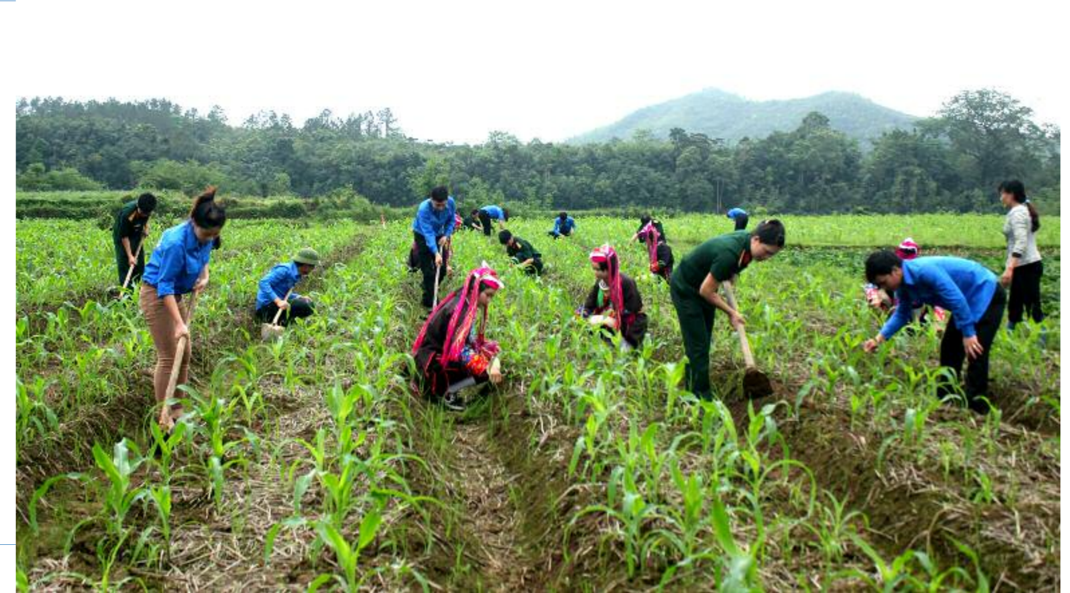
Cán bộ, chiến sỹ Đồn Biên phòng Bắc Sơn cùng đoàn viên thanh niên giúp nhân dân thôn Phình Hồ, xã Bắc Sơn, TP Móng Cái phát triển sản xuất