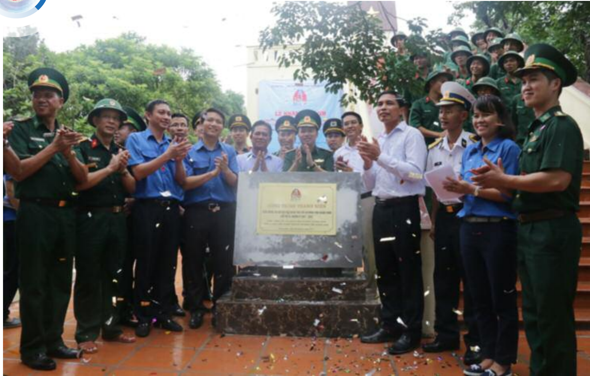
Lãnh đạo Trung ương Đoàn và lãnh đạo tỉnh khánh thành công trình Thanh niên “Đường dẫn, khuôn viên, nhà lưu niệm Cột cờ chủ quyền Tổ quốc” trên đảo Trần (huyện Cô Tô)