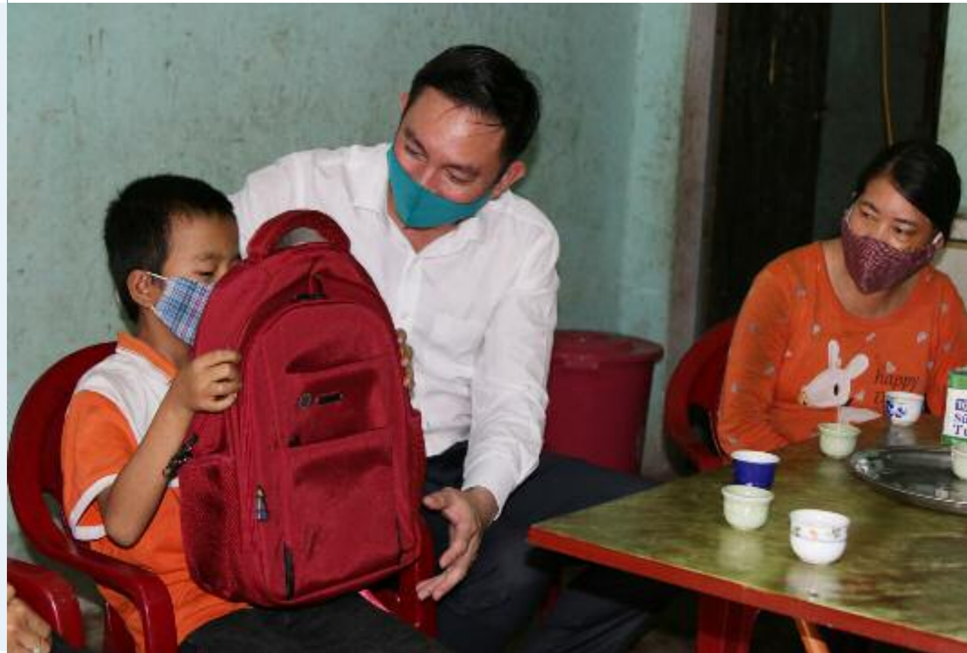
Đồng chí Lê Hùng Sơn, Bí thư Tỉnh đoàn thăm và động viên học sinh có hoàn cảnh khó khăn trước khi nhập học trở lại sau đợt giãn cách xã hội phòng chống dịch bệnh COVID-19