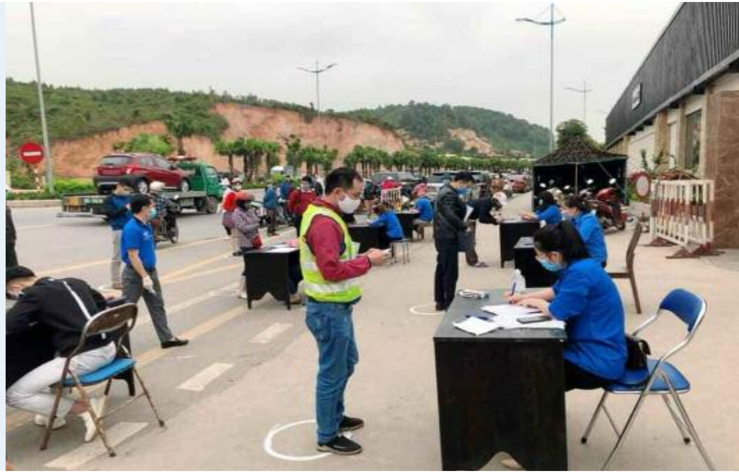
Thanh niên tình nguyện hỗ trợ các thủ tục tại các chốt phòng chống dịch bệnh COVID-19