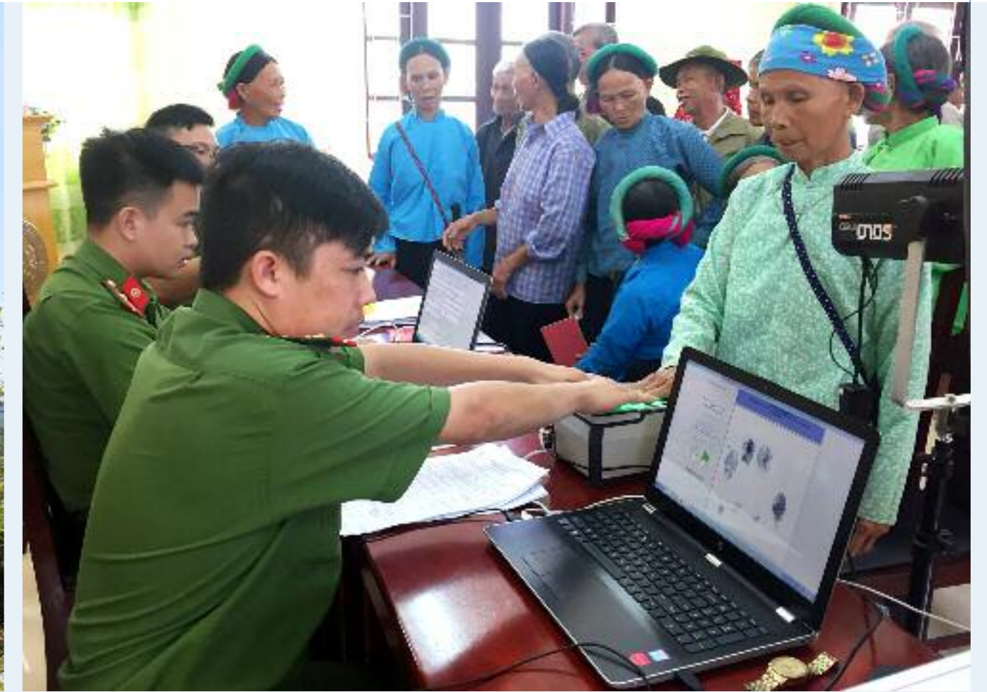
Công an huyện Tiên Yên xuống cơ sở làm thẻ căn cước công dân cho người dân vùng sâu, vùng xa