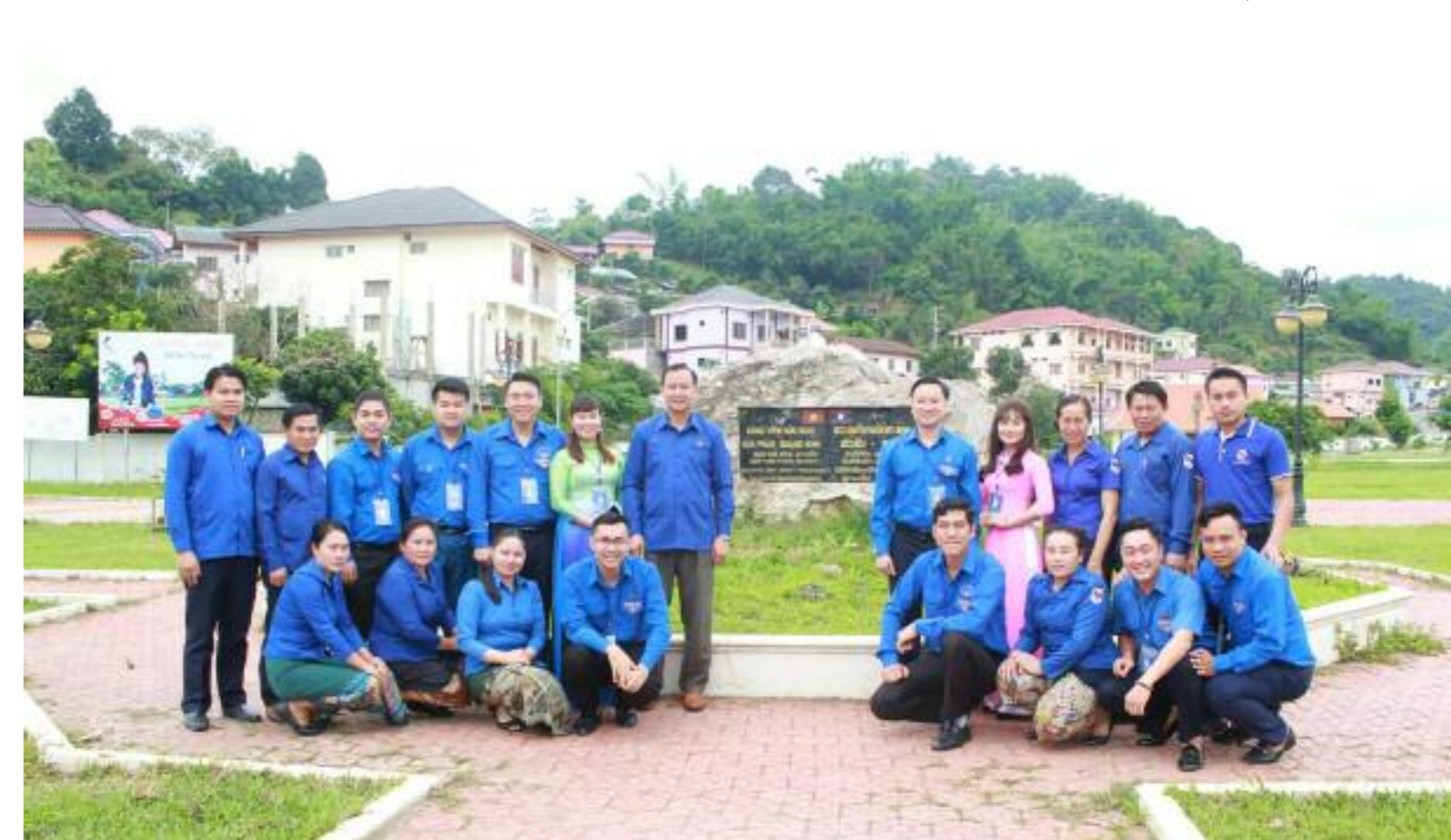
Đoàn đại biểu thanh niên Quảng Ninh tổ chức chương trình giao lưu hữu nghị tại tỉnh Hủa Phăn (Lào)