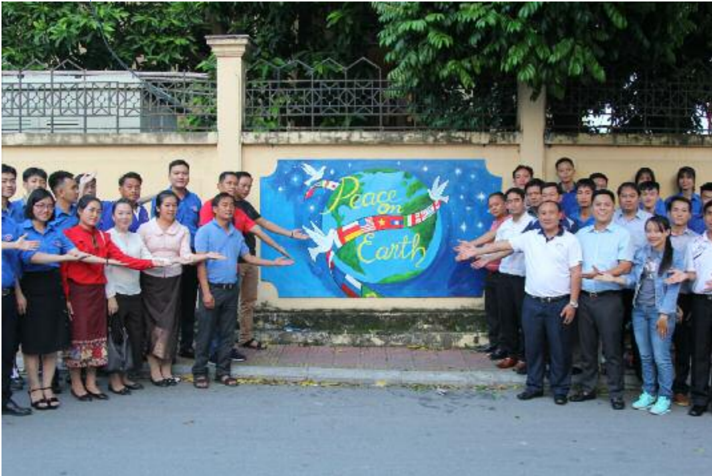
Hoạt động tình nguyện "vẽ tranh tường bảo vệ môi trường" của các Đoàn Đại biểu thanh niên 3 tỉnh kết nghĩa Bắc Lào trong khuôn khổ chương trình giao lưu thanh niên tỉnh Quảng Ninh và thanh niên 3 tỉnh Bắc Lào năm 2019 tại thành phố Cẩm Phả.