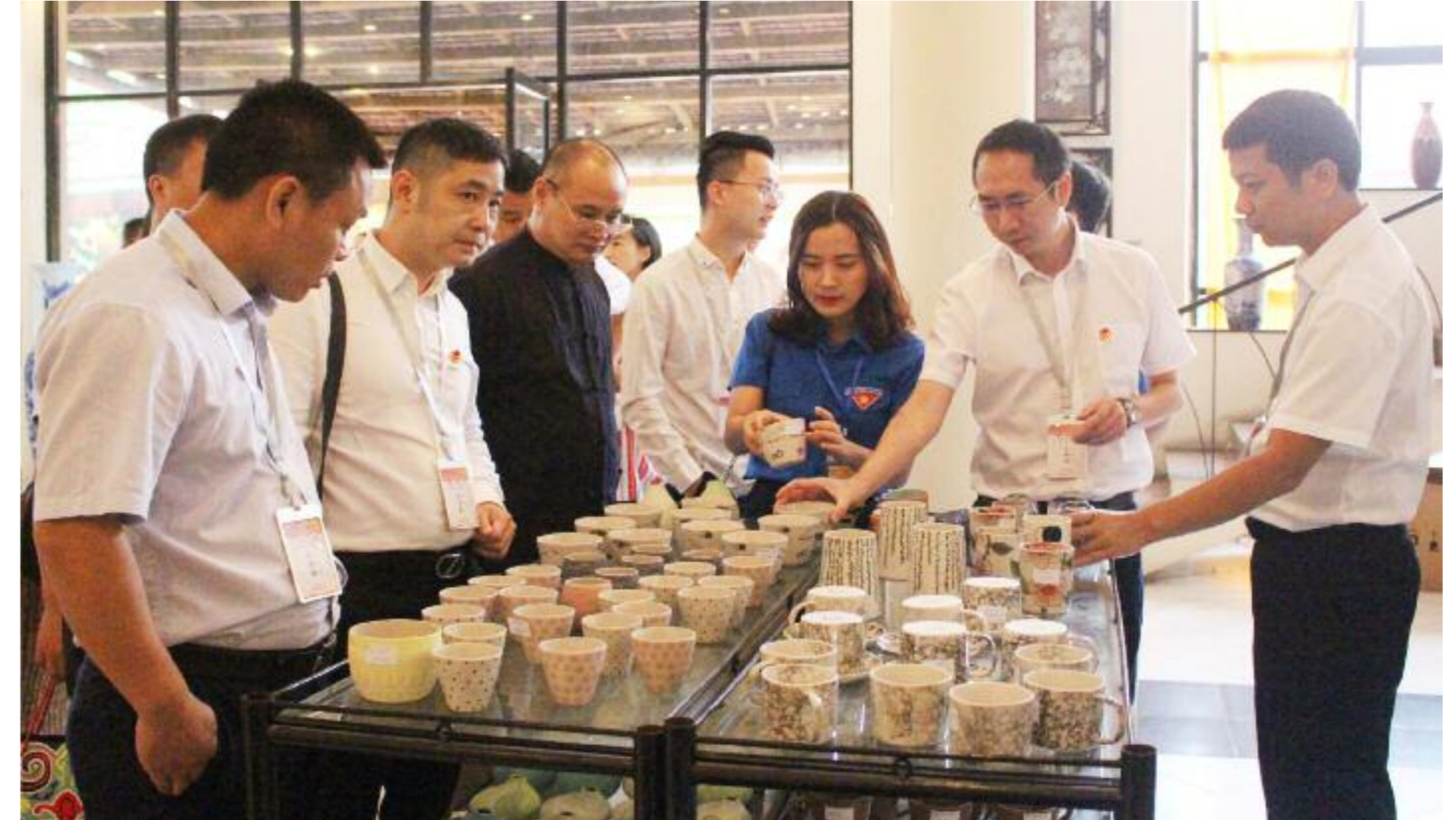
Đoàn đại biểu Thanh niên Quảng Tây (Trung Quốc) thăm quan sản xuất sản phẩm gốm sứ ở thị xã Đông Triều, năm 2018