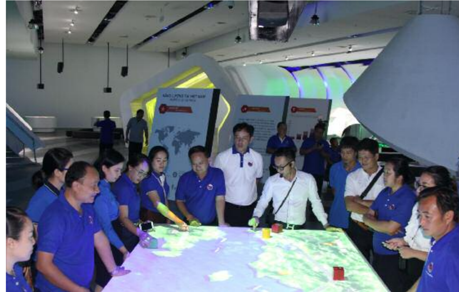
Giới thiệu thành tựu phát triển kinh tế- xã hội của Quảng Ninh với Đoàn đại biểu thanh niên 3 tỉnh Bắc Lào