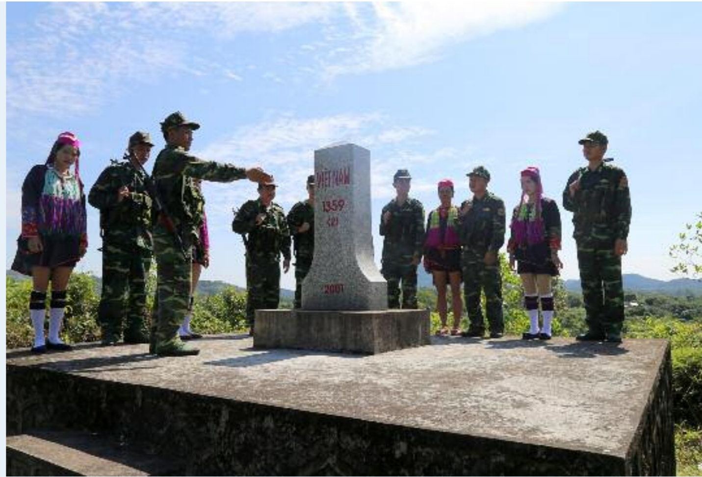
Tuyên truyền chủ quyền biên giới