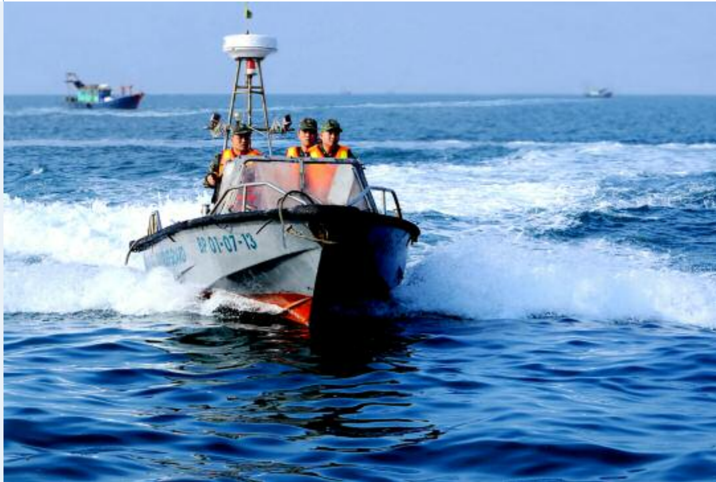
Đoàn viên thanh niên Bộ đội Biên phòng tỉnh tham gia tuần tra biên giới trên biển