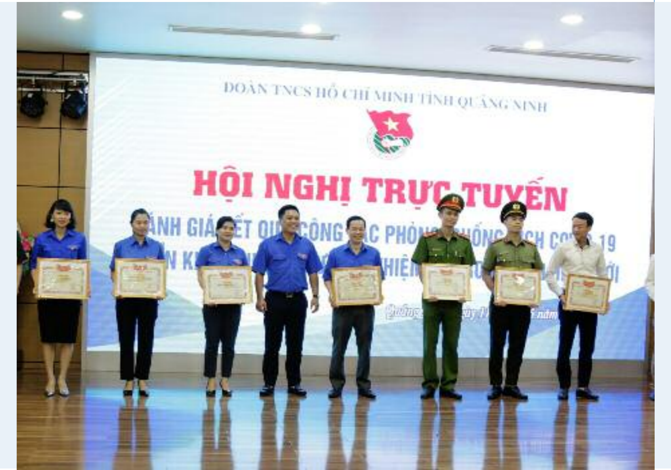
Biểu dương các tập thể cá nhân có thành tích xuất sắc trong công tác phòng chống dịch bệnh COVID-19