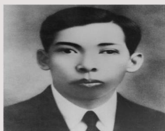
ĐỒNG CHÍ TRẦN PHÚ (1904-1931)