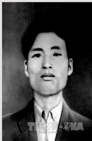
ĐỒNG CHÍ NGUYỄN VĂN CỪ (1912 - 1941)