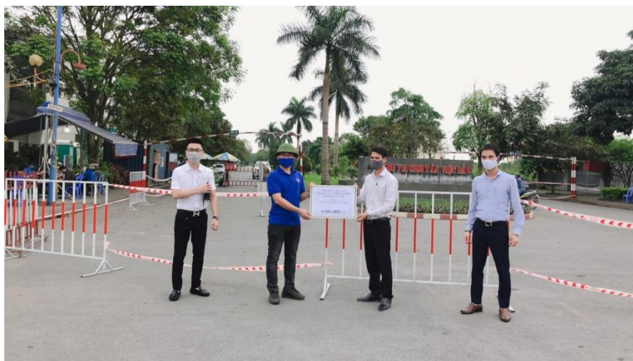
Cán bộ, chiến sĩ Trung đoàn 244 được tiếp nhận nước sạch.

Hưởng ứng chương trình “Cùng Áo xanh thắng nhanh COVID-19”, Ngày 19/4, Ban Thường vụ Tỉnh đoàn Quảng Ninh phối hợp với Công ty Cổ phần Nước sạch Quảng Ninh tặng 1.000 bình nước lọc (loại 20 lít) cho các chốt kiểm soát liên ngành phòng, chống dịch COVID-19 trên địa bàn tỉnh.