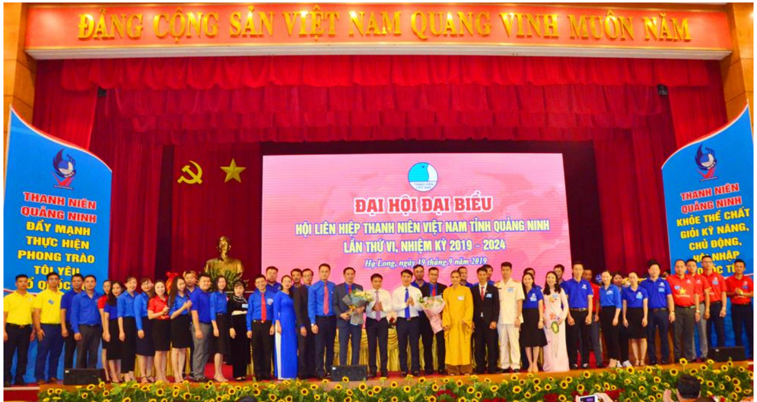
Các thành viên Ủy ban Hội LHTN Việt Nam tỉnh Quảng Ninh khóa VI chụp ảnh lưu niệm cùng lãnh đạo và các vị đại biểu.

Ninh rèn đức, luyện tài, đoàn kết, xung kích, tình nguyện xây dựng tỉnh ngày càng giàu đẹp, văn minh, hiện đại” của Tỉnh ủy - HĐND - UBND - Ủy ban MTTQ tỉnh.\