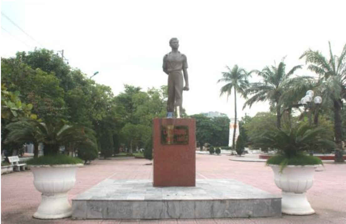
Tượng đài Lý Tự Trọng tại công viên mang tên anh ở thành phố Hà Tĩnh.

Lý Tự Trọng – Người đoàn viên thanh niên Cộng sản đầu tiên được Đảng và Bác Hồ kính yêu đùm bọc, giáo dục từ tuổi thiếu niên đã nêu cao khí tiết cách mạng, chịu đựng mọi cực hình tra tấn của kẻ thù quyết không khai báo nửa lời để bảo vệ cơ sở, bảo vệ đồng chí, đồng bào. Đặc biệt trước tòa án đế quốc thực dân, Lý Tự Trọng đã hiên ngang tuyên bố: “Con đường của thanh niên chỉ là con đường cách mạng, không thể có con đường nào khác” .