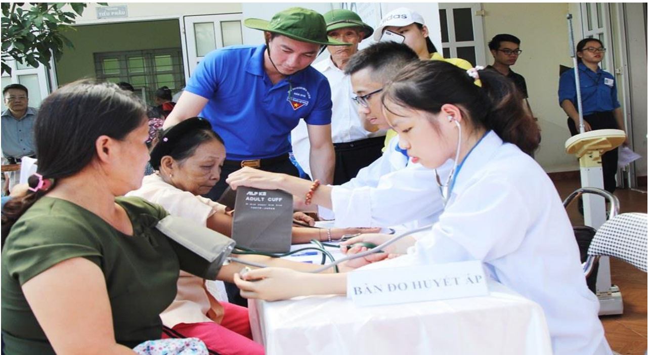
Hoạt động khám bệnh và cấp phát thuốc cho người nghèo, người có công với cách mạng