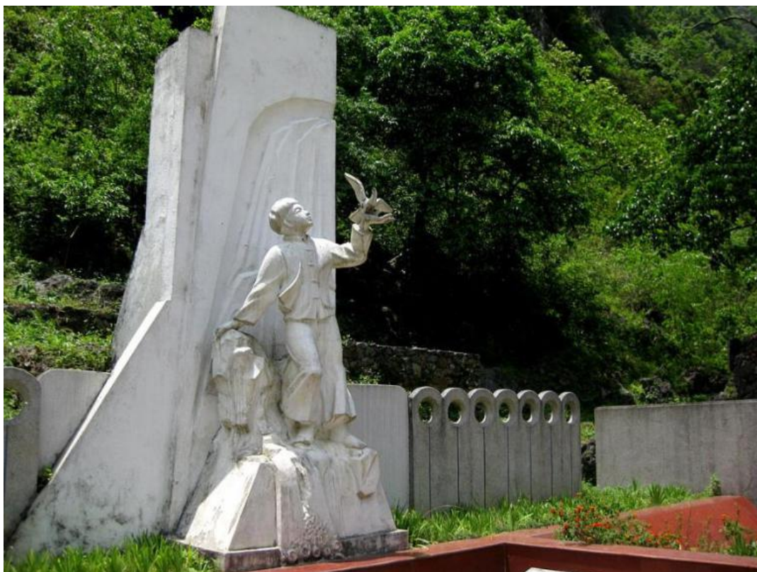
Tượng đài Anh hùng liệt sỹ Kim Đồng tại Khu di tích Anh hùng liệt sỹ Kim Đồng, làng Nà Mạ, xã Trường Hà (Hà Quảng).

Kim Đồng - Đội trưởng đầu tiên của Đội Thiếu niên nhi đồng cứu quốc làng Nà Mạ, tham gia cách mạng từ nhỏ. Với lòng gan dạ, dũng cảm, tấm gương hy sinh anh dũng của Kim Đồng đã được ghi vào lịch sử của Đội Thiếu niên tiền phong Hồ Chí Minh.